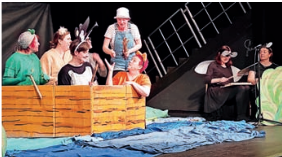
S predstave Bobek in barčica