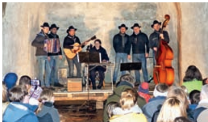
Štedientje so nastopili pred polno utrdbo na Hlavčih Njivah.

Prvo soboto v marcu so Štedientje na tradicionalnem koncertu na Hlavčih Njivah v nabito polni podzemni utrdbi Rupnikove linije z nastopom navdušili zbrano občinstvo. Z milo zvonečimi citrami se jim je pridružila tudi Martenkova Barbara. Skupina v letošnjem letu praznuje dvajset let obstoja, zato načrtujejo poseben dogodek, ki bo obeležil njihov jubilej. So tudi pred izdajo svojega tretjega albuma.