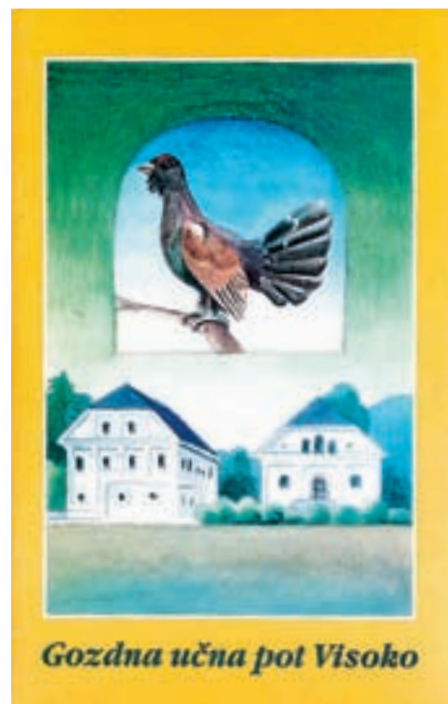
Za simbol Gozdne učne poti Visoko so izbrali divjega petelina.